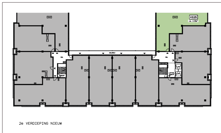
2e VERDIEPING NIEUW