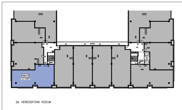
2e VERDIEPING NIEUW